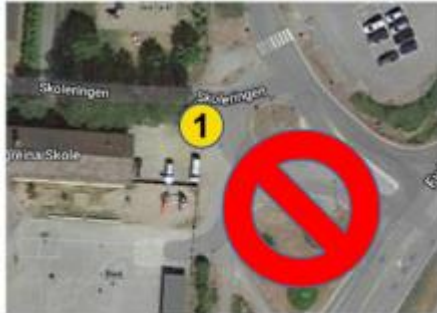
Rundkjøring ved skolen

På grunn av sikkerheten til elevene, er det kun et sted foresatte kan stoppe bilen når de levere eller henter sine barn: Parkeringsplassen ved barnehagen.