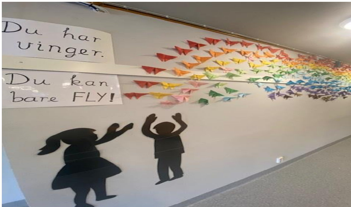
Trivselsuke-prosjekt. Alle elever laget hver sin sommerfugl.

Mogreina skole har rutiner ved brudd på ordensreglementet, og kan for eks. kreve erstatning for skolebøker eller annet skoleutstyr som blir ødelagt.