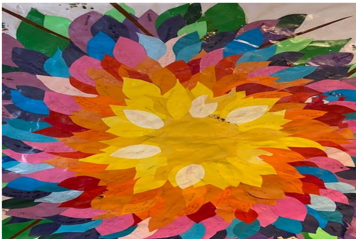
Kunst fra Trivselsuke. Vennskapsblader.