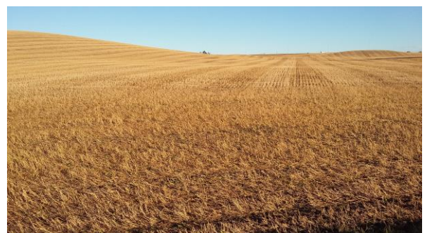
Det er økende oppslutning om å så direktesådd høstkorn.

Her kan du lese mer om Regionalt miljøtilskudd, oppslutning og hvilke tilskuddssatser som ble vedtatt