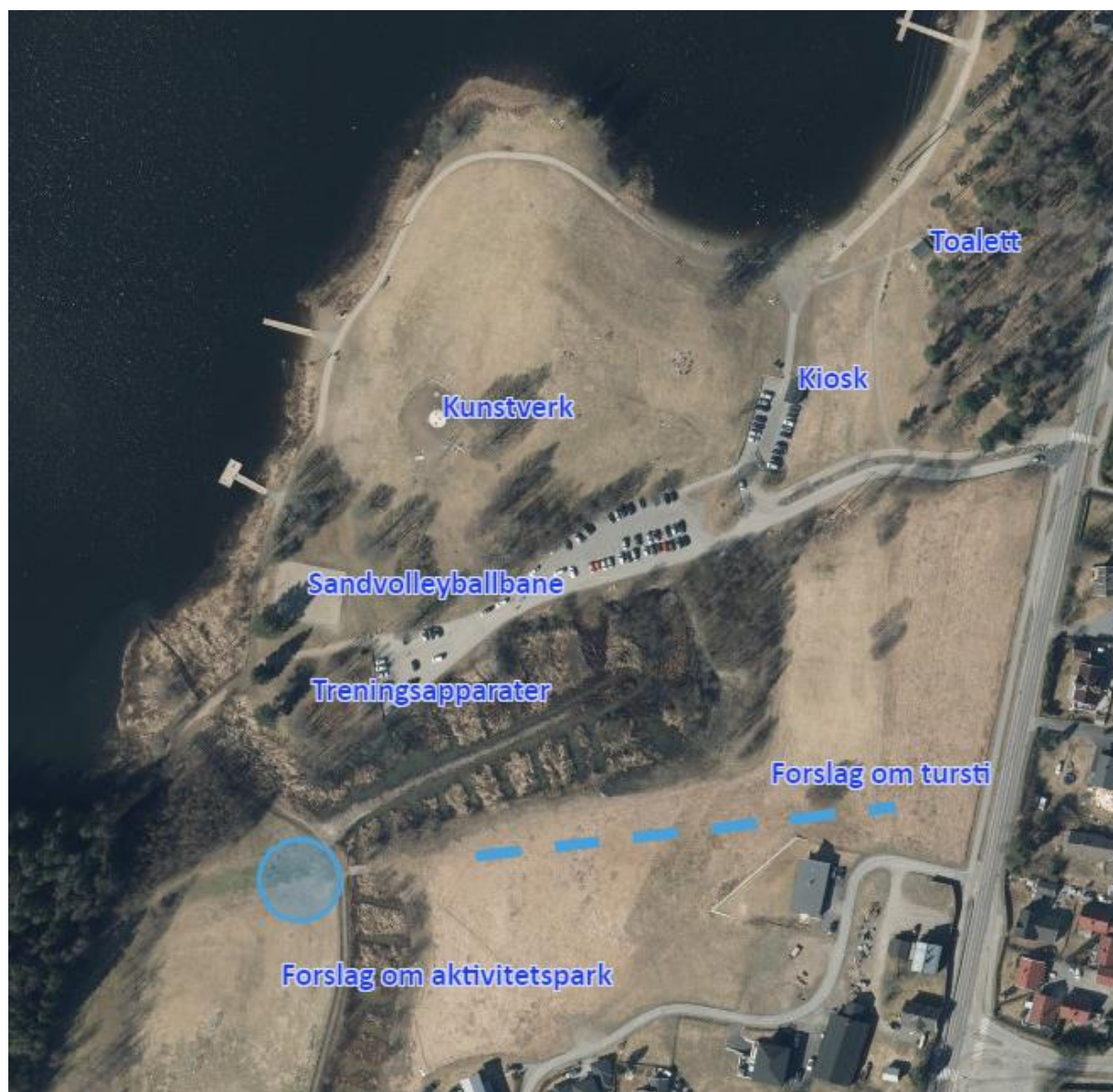
Kart over deler av sikret område med tiltak