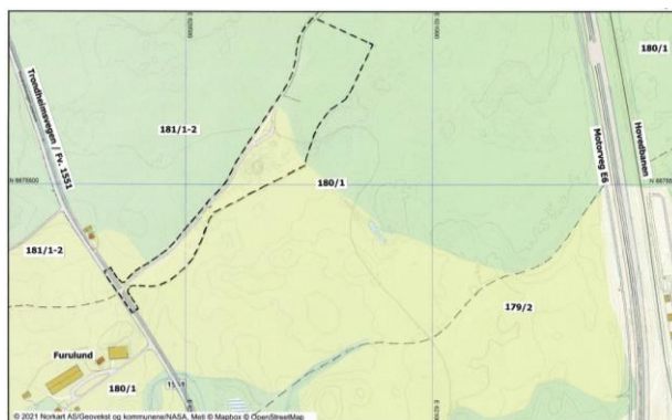
Plangrensa er vist med svart stippet strek.

Planområdet ligger mellom Trondheimsvegen, fv. 1551 og jernbanen/Hovedbanen på garden Furulund Søndre, gnr. 180 bnr. 1. Det utgjør ca. 50 daa og består i dag av skogsmark, noe tidligere dyrket mark som tilbakeføres og vegadkomst med avkjørsel fra fv. 1551. Avgrensningen framgår av kartutsnittet nedenfor: