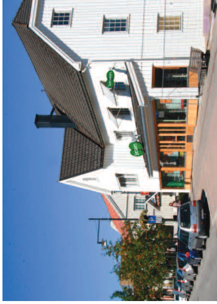
Apotekergården 2009.

Tok en tur til Jessheim i 2010 sto Apotekergården der fremdeles. Fasaden ut mot veggen var preget av 1980-tallets mest populære bygningselement, karnappvinduet. Og ikke ett, men tre. I tillegg var husmorvinduer med sprosser og markiser på plass rundt det hele. Den en gang moderne funksjonalismen var blitt umoderne, og lempet ut og bygget inn. Men om dette føltes riktig i jappetida, så føltes det feil i 2010. Og fra å ha vært kontorer skulle bygget igjen bli butikk, med behov for utstillingsvinduer. For første gang i husets historie, det moderne ble det forgangne. Apotekergårdens ansikt ble igjen funksjonalismens, med store vinduer, eikpanel og utgangspunkt i de gamle tegningene. Husets fasade er som et ansikt, med rynker, arr og særpreg. Titter du nærmere på Apotekergården kan du finne sporene fra tiden som er gått, en historie formet i byggematerialer.