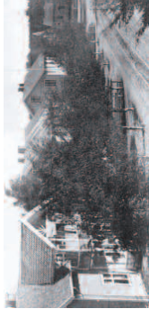
Husene nederst i Storgata, før 1915. Apotekergården, Rosendal, Solheim, Meienet og poståpneriet.