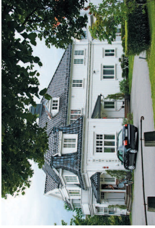
Foto motsatt side: Lønnebo en gang på 1920-tallet. Guttene i bakken opp Gotaasalléen ser ut til å ha en siri lørn med kjerra opp bakken.

Det står et lite nasjonalromantisk stabbur i hagen opp mot Herreds- huset. Det er trolig bygget 1909,