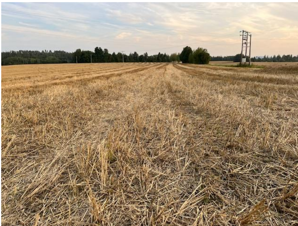
Bilde 2: Overvintring av jorder i stubb er et godt tiltak for forbedret vannkvalitet i våre vassdrag

Link inn til søknadsskjemaet og veiledning finnes på www.landbruksdirektoratet.no