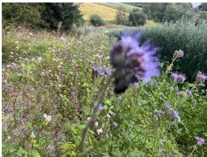
Bilde 1: Mange har sådd soner for pollinerende insekter, og det er mulig å søke om RMP-tilskudd for disse tiltakene

De som skal søke tilskudd til regionale miljøtiltak kan gjøre dette i perioden 15. september til 15. oktober. Alle foretak som søkte produksjonstilskudd i 2023 vil få tilsendt en SMS med lenke med mer informasjon om tilskuddsordningen og elektronisk søknad. Les mer på temasiden om regionale miljøtilskudd .